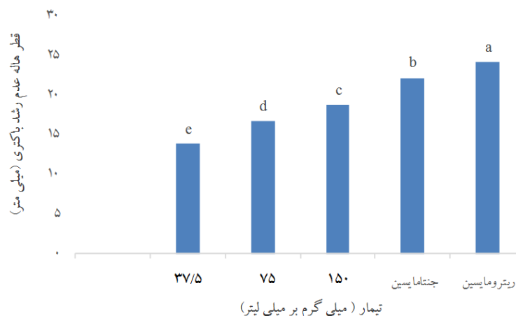
شکل ۲: مقایسه اثر ضد باکتریایی عصاره آبی گل درخت گردو با آنتی‌بیوتیک‌های رایج علیه باکتری آئروموناس هیدروفیلا.

غلظت‌های ۱۵۰، ۷۵ و ۳۷/۵ میلی گرم بر میلی لیتر عصاره اتانولی گل درخت گردو با هم اختلاف معنی‌داری به ازای قطر هاله عدم رشد داشتند. با توجه به اختلاف معنی‌دار غلظت‌های مختلف عصاره نتایج بازگوکننده افزایش اثر ضد باکتریایی عصاره به ازای افزایش غلظت آن‌ها می‌باشد، می‌توان گفت با افزایش غلظت عصاره، قطر هاله بازدارندگی نیز افزایش می‌یابد.