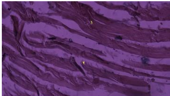
شکل ۳: مشاهده نفوذ سلول‌های آماسی (۱) و تخریب فیبرهای عضلانی (۲) در عضله ماهی (H&amp;E, 40X)