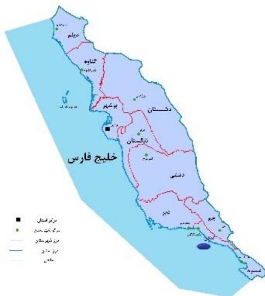
شکل ۱: نقشه منطقه مورد مطالعه در استان بوشهر - بندرکنگان

نتایج حاصل از سنجش سرب و نیکل در بافت عضله ماهی باس دریایی پرورشی به شرح جدول ۲ به- دست آمد. البته شایان ذکر است که میانگین غلظت سرب و نیکل در بافت عضله ماهی باس دریایی پرورشی مورد مطالعه به ترتیب ۰/۷۶ میکروگرم بر گرم و ۱/۱۶ میکروگرم بر گرم محاسبه گردید.