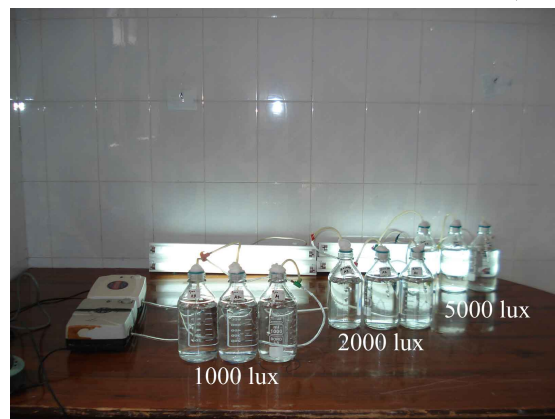
شکل ۱: تیمارهای مختلف شدت نور ۱۰۰، ۲۰۰۰ و ۵۰۰۰ لوکس

شدت‌های مختلف نوری تیمارهای مختلف مطالعه تنظیم گردید (شکل ۱).