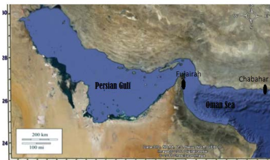
شکل ۱. موقعیت مناطق نمونه‌برداری

از آنجایی که داشتن توالی DNA مربوط به یک منطقه خاص از ژنوم یک گونه این اجازه را می‌دهد تا همین منطقه خاص از ژنوم مربوط به گونه‌های بسیار نزدیک یا جمعیت‌های مشابه آن را با همان آغازگر تکثیر کرد، با آزمودن نشانگرهای موجود در آزمایشگاه، بهترین نشانگر که مربوط به ماهی آزاد دریای خزر ( Caspian Salmo trutta ) (Atabeyoglu, ۲۰۰۸) است، انتخاب شد.