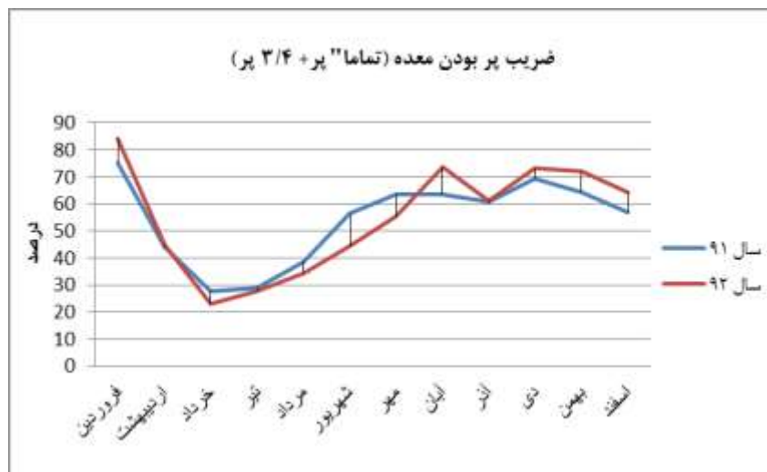
شکل ۴: منحنی تغییرات ضریب پر بودن (۳/۴ و تماماً پر) معده و روده ماهیان حلوا سفید خلیج فارس در ماه‌های مختلف سال

محدوده زمانی بین ماه‌های اردیبهشت - شهریور پائین و خرداد با (۲۵/۴٪) در حداقل میزان خود قرار دارد. ضریب خالی بودن معده (Vacuity index) در ماهیان مورد مطالعه بر اساس دستور CONOVER به مقدار ۱۵/۶۱ درصد، محاسبه گردید.