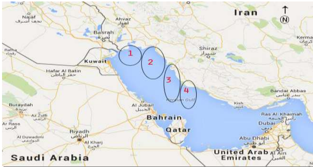
شکل ۱: ایستگاه‌های نمونه برداری روی نقشه جغرافیایی خلیج فارس

۱۳۹۳)، مشخصات جغرافیایی مناطق نمونه برداری به ترتیب در جدول ۱ و شکل ۱ نشان داده شده است (فراهانی و مرادی، ۱۳۷۷).