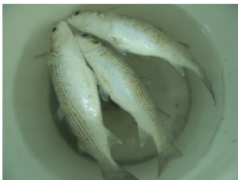
شکل ۱: وضعیت فرارگیری ماهیان بیمار در آب