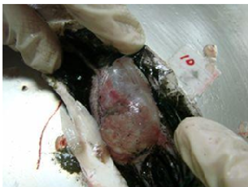
شکل ۲: بادکردگی کیسه شنا در ماهیان بیمار

مهم ترین یافته اتساع شدید کیسه شنا بود (شکل ۲). هیچگونه مایعی در داخل محوطه بطنی مشاهده نگردید. کیسه صفرا در این ماهیان کاملاً پر بود که عدم تغذیه طولانی مدت را نشان می داد. نتایج حاصل از بیومتری و تعیین سن ماهیان در جدول ۱ آمده است.