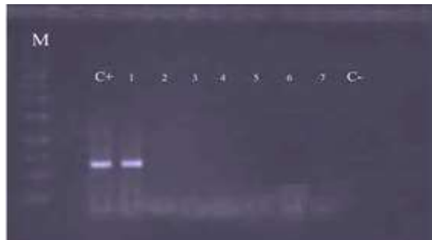
شکل ۳: محصول PCR ژن trh در ژل آگارز ۲٪