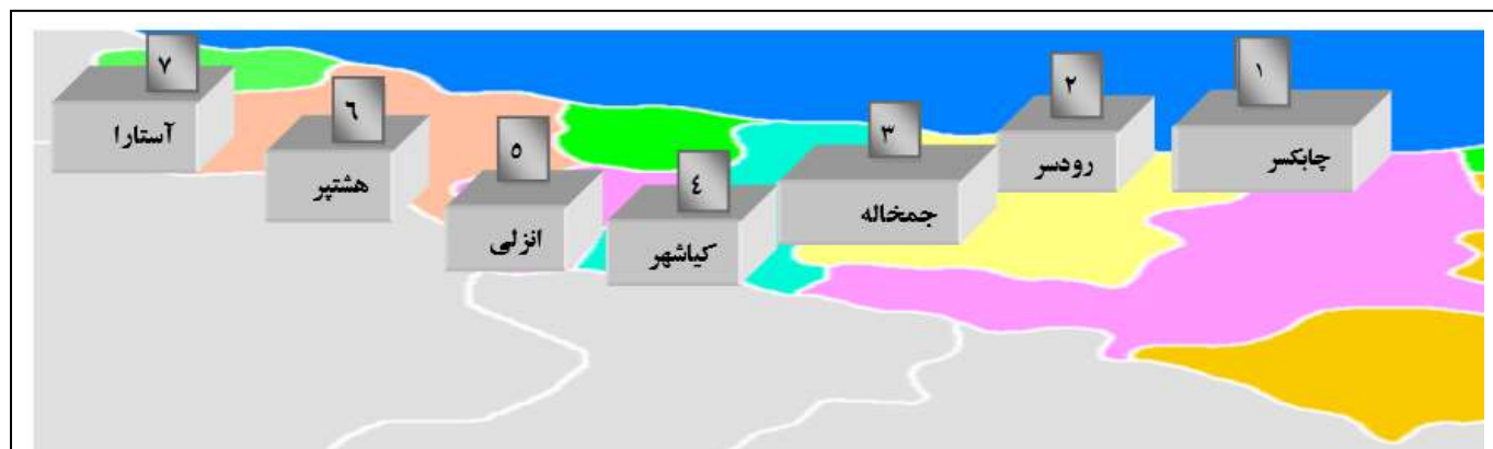
شکل ۱: ایستگاه های نمونه برداری در سواحل دریای خزر در استان گیلان

و تا رقت ۳-۱۰ از آن رسوب تهیه شد. این محیط به مدت ۱۶-۲۴ ساعت در دمای ۳۷ درجه سانتی گراد انکوبه گردید. در مرحله بعد مقداری از محتویات محیط APW را بر روی محیط TCBS کشت خطی داده و به مدت ۲۴ ساعت در ۳۷ درجه سانتی گراد انکوبه گردید. سپس محیط TCBS از نظر وجود کلنی های سبز (سوکروز منفی) و کوچک و سبزی در آزمایشگاه مورد بررسی قرار گرفت. کلنی های سبز مذکور به صورت خالص بر روی محیط TCBS آگار دیگر کشت داده می شد. کلنی با مشخصات بالا به محیط Chrom Agar برده شدند و بعد از مدت ۲۴ ساعت انکوباسیون این محیط از نظر وجود کلنی های بنفش مورد بررسی قرار گرفت (Veetil et al. , 2014).