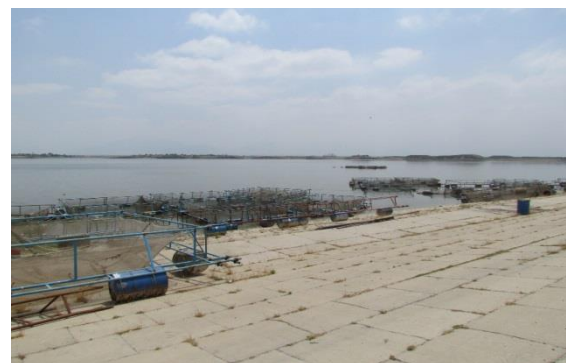
شکل ۲: مرحله‌ی تکمیل ساخت قفس‌ها در سد گلستان