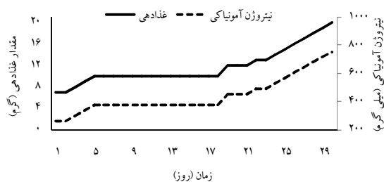
شکل ۱: مقادیر غذادهی روزانه و آمونیاک ورودی به سیستم طی دوره فعال سازی بیوفیلترها

روز به ۴/۲٪ (۱۰ گرم به هر تانک) افزایش یافت. مقدار غذادهی تا روز ۱۸ ثابت بود، سپس با کاهش آمونیاک آب تانک‌های پرورشی، مقدار غذادهی به صورت تدریجی افزایش یافت. به تبع افزایش مقدار غذادهی، ورودی آمونیاک به هر سیستم نیز افزایش یافت، به طوری که در ابتدای دوره، مقدار آن ۲۶۵ میلی گرم و در انتهای دوره، ۷۵۶ میلی گرم بود (شکل ۱).