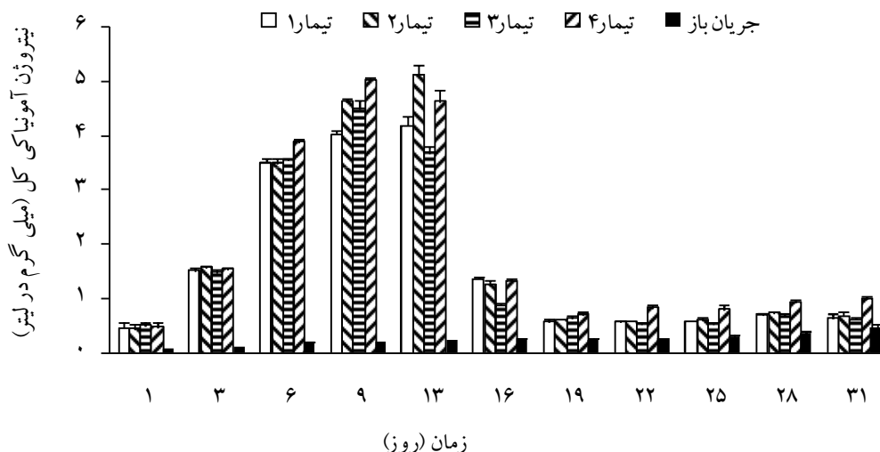
شکل ۲: تغییرات نیتروژن آمونیاکی تیمارهای مختلف طی دوره فعال‌سازی بیوفیلترها. مقادیر به صورت میانگین \pm خطای معیار هستند.

ترتیب ۴/۲، ۵/۱ و ۴/۶۳ میلی‌گرم در لیتر) در روز سیزدهم اتفاق افتاد و سپس روند نزولی نشان داد (شکل ۲). از روز نوزدهم به بعد مقادیر نیتروژن آمونیاکی تیمار ۴ به طور معنی‌داری بیش‌تر از سایر