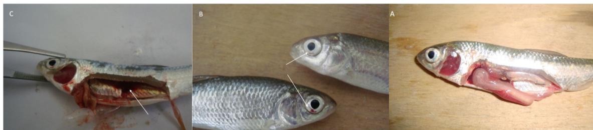
شکل ۳: بررسی علایم کلینیکی و کالبد گشایی در ماهیان مواجهه شده با آمونیاک مولکولی: عدم مشاهده عارضه غیر طبیعی در گروه شاهد (A)، خونریزی در قاعده چشم‌ها در گروه‌های تیمار (B) و پرخونی در کلیه‌ها (C)